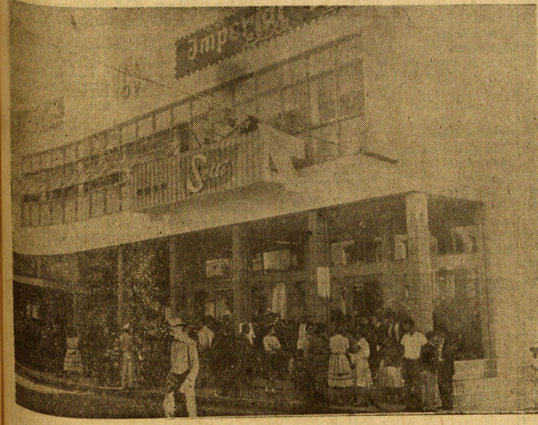
Flagrante recente da Casa Setti

nal firma comercial do Estado do Paraná. Quando iniciou a Casa